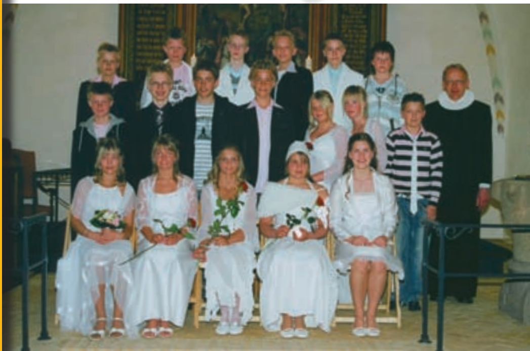
Konfirmander i Voer Kirke