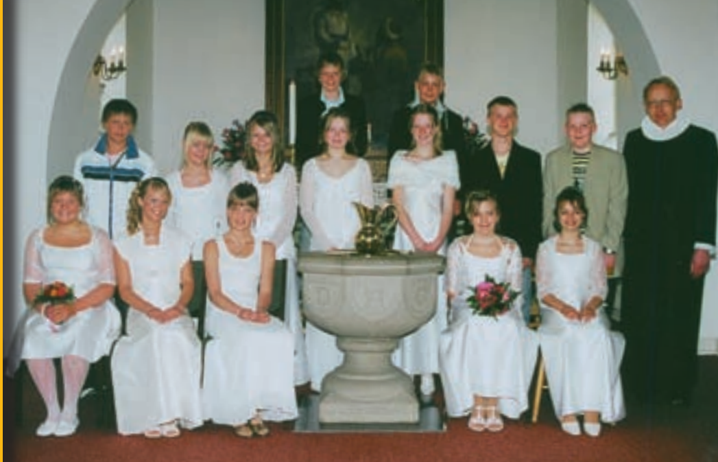
Konfirmander i Agersted Kirke