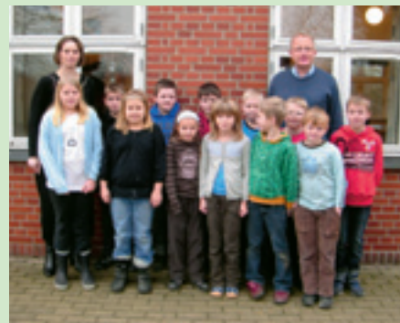
Her ses foran konfirmandstuen de 12 minikonfirmander fra Agersted sogn. De er ligeså søde, som de ser ud.

Dagen vil blive markeret ved en procession af børn, der bærer påskeliljer op til døbefonten, og af at Agersted kirkes børnekor medvirker.